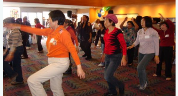
Muchas personas participaron de las clases de tai chi gratuitas durante la inauguración del Centro de Bienestar Comunitario de SFGH, el 15 de julio de 2011.

Con la grúa instalada podemos comenzar a realizar tres grandes coladas de hormigón armado. La primera está programada para principios de septiembre. Se verterá un total de 6000 yardas cúbicas de hormigón durante un período de 20 horas. Para evitar afectar el tránsito durante el día y el funcionamiento del hospital, la colada se llevará a cabo durante la noche. Se utilizarán luces torre para iluminar la obra de construcción. Los camiones de hormigón ingresarán y saldrán del campus en un ciclo continuo para entregar sus cargas a las cuatro grandes bombas de hormigón.