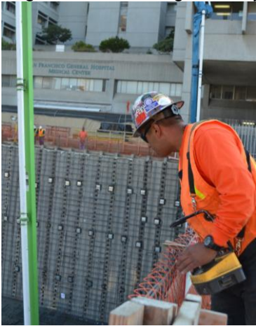
An operator guides the concrete pumps arm with remote control

A 20-hour concrete pour for the foundation of the new hospital began on the evening of Friday, September 9 th and continued through the following Saturday morning. Enough concrete was poured at the SFGH Rebuild site to fill a football field-size hole, three feet deep. The first of 600 concrete trucks arrived on site at 11pm on Friday dumping concrete into one of four pumps on the construction site. Meanwhile workers in the pit below guided the pump hoses to fill the four-foot thick rebar framework with concrete.