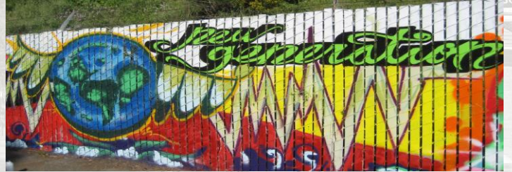
Mural del New Generation Health Center en la calle 18 y Potrero Ave.