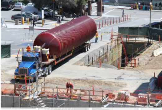
The emergency water tank was recently installed at SFGH

San Francisco General Hospital is the only trauma center