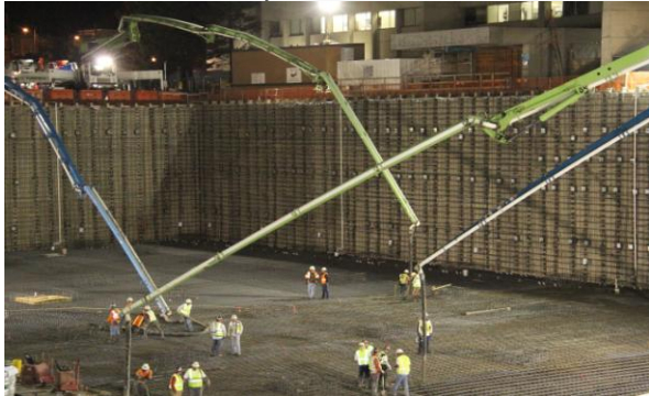
Workers spread concrete coming from the arms of four concrete pumps

We are happy to report that only one more large pour is needed to complete the foundation. It is scheduled to begin on Friday, October 21 st at 8pm and end the next day by 6pm. The logistics will be very similar to the first pour, but this time concrete trucks will enter the construction site on Potrero Ave. in addition to 22 nd and 23 rd Streets. Because the second pour must fill a larger area, it will last two hours longer. We will continue to keep our neighbors well informed through extensive community outreach.