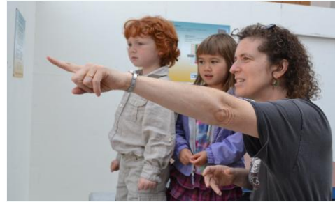
Miembros de la comunidad se detuvieron a ver la emocionante colada de hormigón

La colada de 20 horas de hormigón para los cimientos del nuevo hospital comenzó la tarde del viernes, 9 de septiembre y continuó hasta el siguiente sábado por la mañana. Se vertió suficiente hormigón en la obra de la