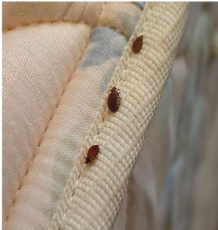
床蟲伏窩於床褥上